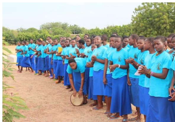
Quel accueil à La Toden !