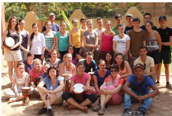
Le groupe 2013