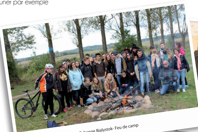
Echange Bialystok- Feu de camp