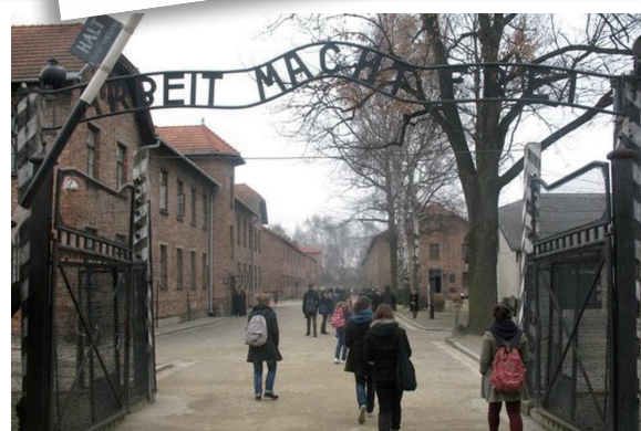
Echange Miechow- Visite Auschwitz