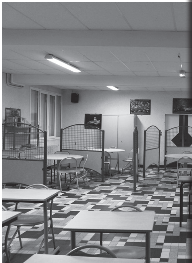
Ancien espace de restauration transformé en espace de travail pour le moment

Suite à ce projet, il reste à l'équipe de direction à trouver une nouvelle fonction pour l'espace qui s'est libéré. Certains parlent de salles de cours, d'une salle d'étude ou d'une salle pour les internes mais pour l'instant rien n'a été décidé définitivement car ça engage aussi un coût qui est en cours d'estimation.