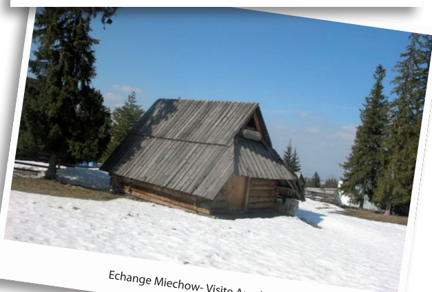
Echange Miechow- Visite Auschwitz