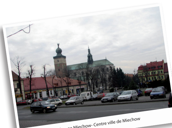
Echange Miechow- Centre ville de Miechow