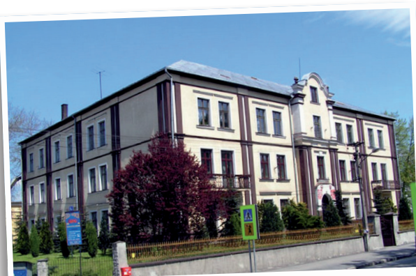
Echange Miechow- Lycée Partenaire