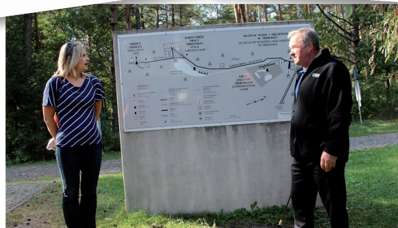
Echange Bialystok - Visite de Treblinka