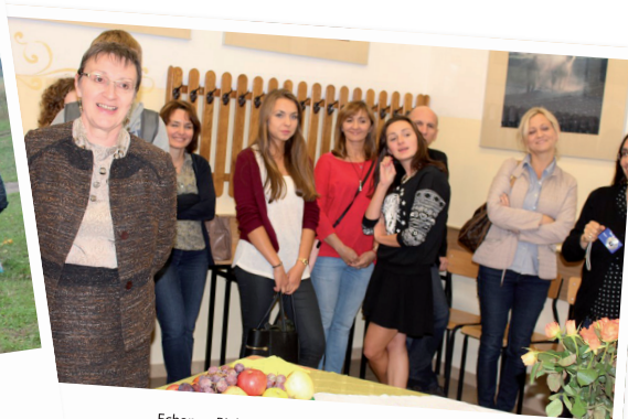
Echange Bialystok- Accueil de la Directrice